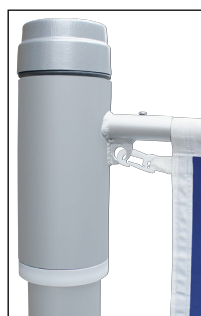
Mastkappe mit Rotor, Teleskopausleger