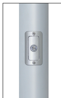
Bediengehäuse SFS ZA 75