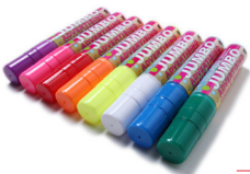
SCRITTO® CHALKMARKERS KREIDESTIFT